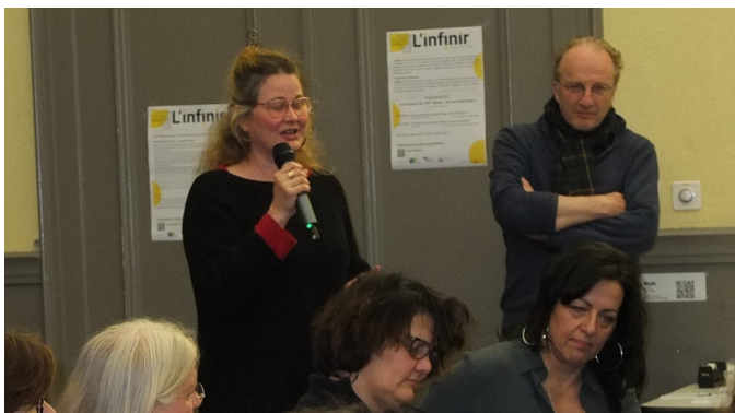
Débat public, Lausanne, 30 mars 2023