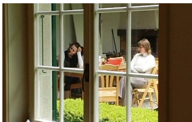
Les vagues et les plis de notre vie , Bernard Romy, 2010